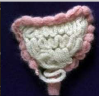
Darmen van breigaren