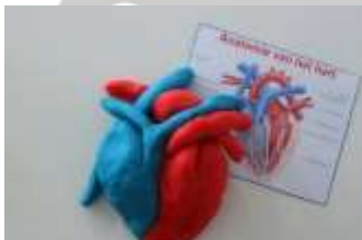
Hart van klei

Teken nu een willekeurig lichaamsonderdeel na of, nog leuker, bouw het na met creatief materiaal. Je kunt de applicatie van de vorige opdracht gebruiken om het onderdeel van alle kanten te bekijken. Hieronder zie je een paar voorbeelden.