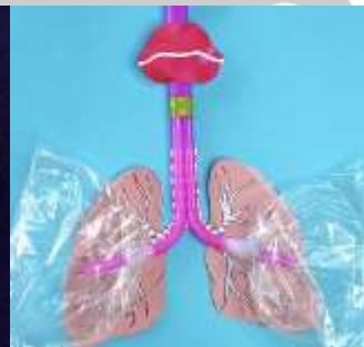
Ademhalingstelsel van o.a. boterhamzakjes en rietjes